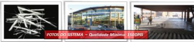
FOTOS DO SISTEMA – Qualidade Mínima: 150DPIS