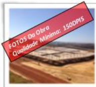
FOTOS Da Obra Qualidade Mínima: 150DPIS