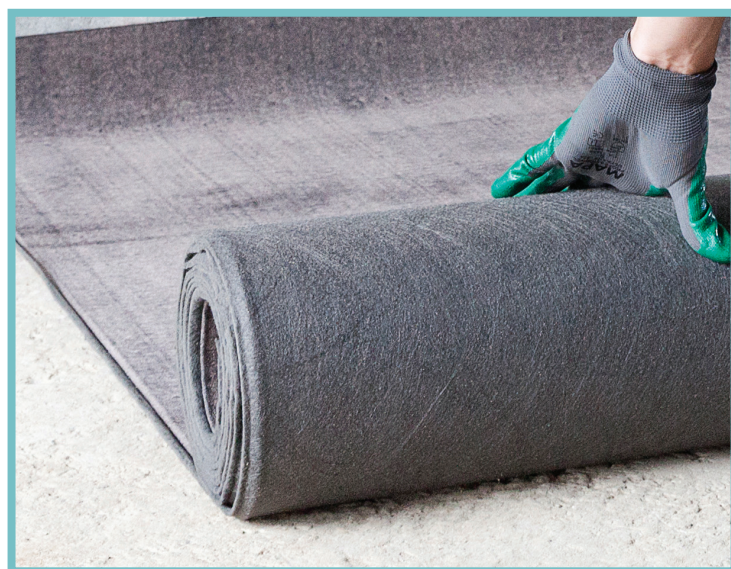
Manta Viapol Antirruído® - 5 mm e 3 mm sistema flutuante

Estruturada com não tecido de fibra de vidro produzida com asfalto especial, acoplada à geotêxtil de alta gramatura, nas espessuras de 5 mm e 3 mm. Com amortecedor de impacto e propriedades acústicas, apresenta significativa redução acústica entre pavimentos, ou seja, reduz o barulho entre os pavimentos de edifícios.