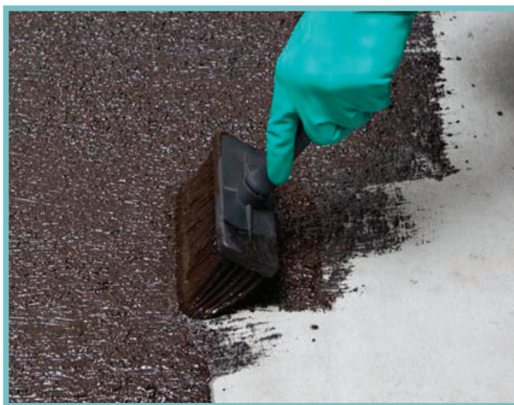
Emulsão Viapol Antirruído® sistema aderido

Estruturada com não tecido de fibra de vidro produzida com asfalto especial, acoplada à geotêxtil de alta gramatura, nas espessuras de 5 mm e 3 mm. Com amortecedor de impacto e propriedades acústicas, apresenta significativa redução acústica entre pavimentos, ou seja, reduz o barulho entre os pavimentos de edifícios.