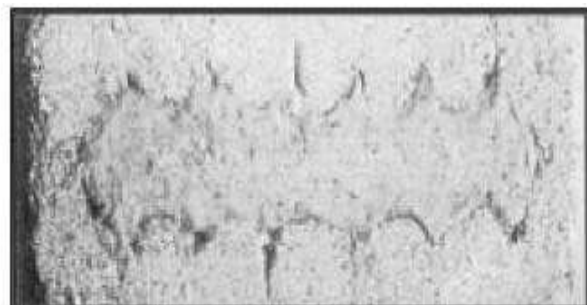
Superstop después de 3 días de mojado